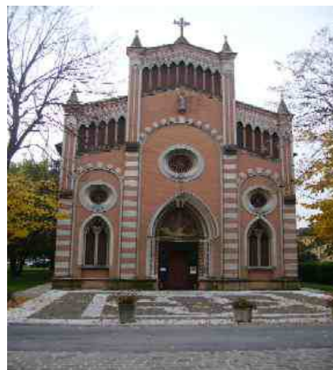
Chiesa interna al parco dell'Istituto Pietro Cadeo

parte degli Ospiti, dei Parenti e degli Operatori. Agli Ospiti, ai familiari e agli operatori viene somministrato un questionario specifico, nel quale gli interessati potranno esprimere, in maniera anonima, il loro gradimento circa la qualità percepita dei servizi erogati. I risultati di tali rilevazioni vengono presentati al Comitato Ospiti-Parenti, esposti al pubblico nella struttura e pubblicati sul sito internet della Fondazione, oltreché commentati in un incontro con i dipendenti. Si allegano i questionari-tipo che vengono annualmente somministrati a cura del Servizio Animazione.